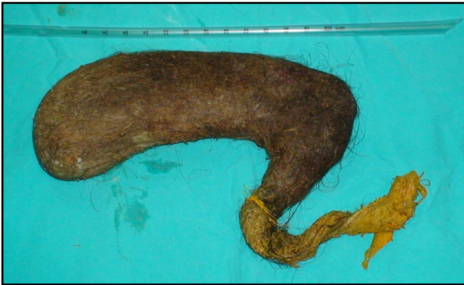
Resim 4. Gastrotomi ile bütün halinde çıkarılan trikobezoar kitlesi.