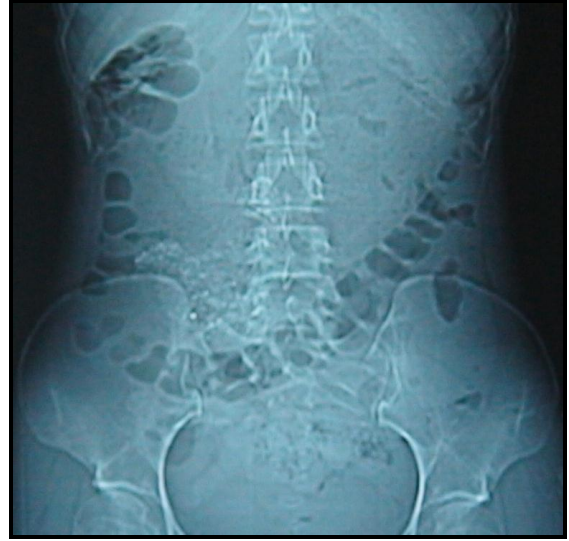
Resim 2. Olgunun ayakta direkt karın grafisi.