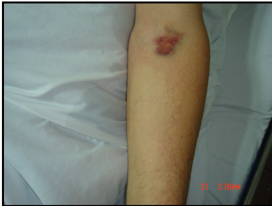
Resim 2. Kol iç yüzünde deri testi sonrası oluşan ekimotik plak.