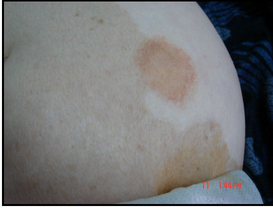
Resim 1. Gövde ön yüzünde 1 adet 4x5 cm çapında ekimotik plak.

depresyon, anksiyete, agresyon, suçluluk duygusu, seksüel uyumsuzluk, düşmanlık hissi, mazoşizm, obsesif davranış ve histerik kişilik gibi tipik emosyonel bozukluk belirtileri gösterirler (6,10). Özyıldırım ve ark. (11) hemattürlü bir olguda GDS sendromunu bildirerek hastalığın psikiyatrik yönüne dikkat çekmişlerdir. Psikojenik etkenlerin etiolojisinde rol oynadığı düşünülen sendromda, burun, kulak, göz, sindirim sistemi gibi farklı bölgelerden kanamalar deri lezyonlarına eşlik edebileceğini bildirdiler. Meeder ve ark. (12) açıklanamayan klinik semptomları bulunan ve stresin tetiklediği GDS'li bir olguyu sunmuşlardır. Yönel ve ark. (13) burun, gözler ve kulaklarda kanama ve psikiyatrik bozukluklarla seyreden GDS'li bir olguyu sunmuşlar, hastalığın çürükler olmaksızın sadece GİS kanaması şeklinde de kendini gösterebileceğini bildirmişlerdir. Kavala ve ark. (1) ise kol ve bacaklarda tekrarlayan ekimozlarla birlikte depresyon, anksiyete bozukluklarına sahip 21 yaşındaki bir olguyu sunmuşlardır. Hastamızda da mutsuzluk ve hayattan zevk almama gibi şikayetler mevcuttu ve psikiyatri muayenesi sonucu yaygın anksiyete ve depresyon tanısı konuldu.