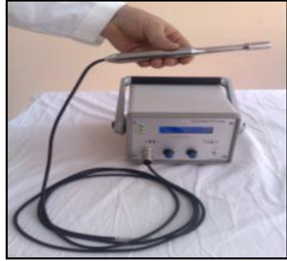
Resim 1. Çalışmamızda kullanılan Crystal probe cihazı görülmektedir.

T4 supresyon tedavisi 22 hastanın tümüne (%100) radyoaktif iyot ablasyon tedavi protokolüne uygun olarak uygulandı.