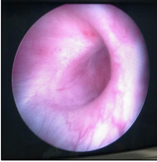
Resim 2. Mesanede supra trigonal bölgede izlenen fistül ağzı (Sistoskopik görüntü)

yaklaşık 18 mm çaplı geniş fistül ağzı dışında herhangi bir patoloji izlenmedi (Resim 2).